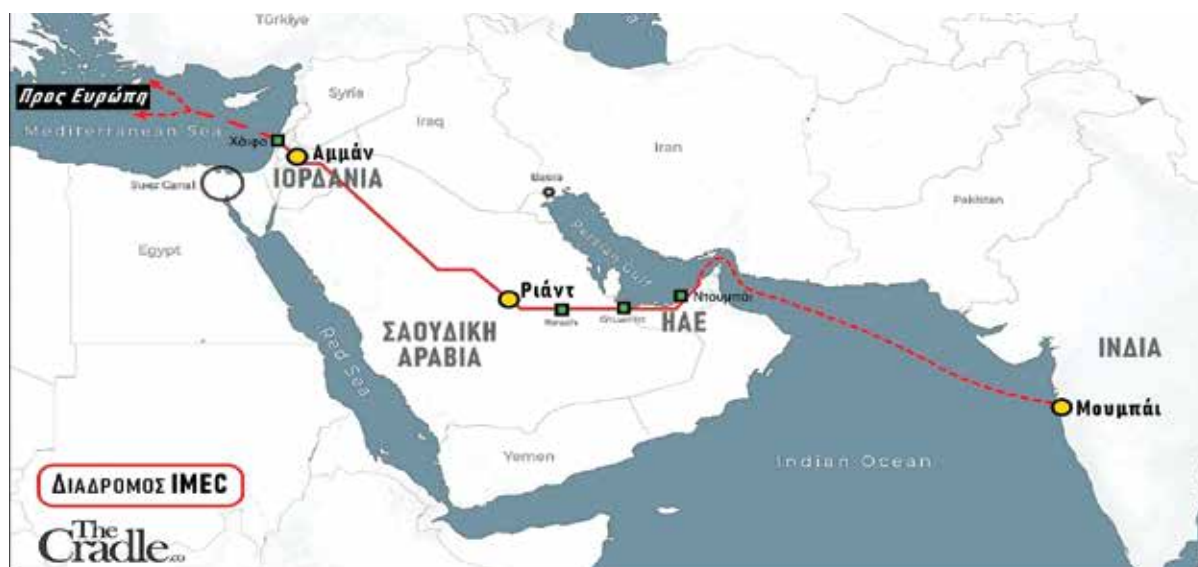
Χάρτης του Διαδρόμου Ινδίας-Μέσων Ανατολής (IMEC)

* Ο Πέπε Εσκομπάρ είναι Βραζιλιάνος συγγραφέας, αρθρογράφος (The Cradle, Asia Times) και γεωπολιτικός αναλυτής. Το παρόν άρθρο του, που εδώ αποδίδεται συντετμημένο, δημοσιεύθηκε στις 20/4/2026 στο The Cradle. Για τον αποκλεισμό αυτού του ανεξάρτητου συνεταιρισμού δημοσιογράφων από τα μέσα κοινωνικής δικτύωσης με απόφαση της META, βλ. «Φίμωση ενός ακόμη ανεξάρτητου MME» (φύλλο 697). ** «St. Petersburg sets the stage for the War of Economic Corridors» (thecradle.co, 18/6/2022).