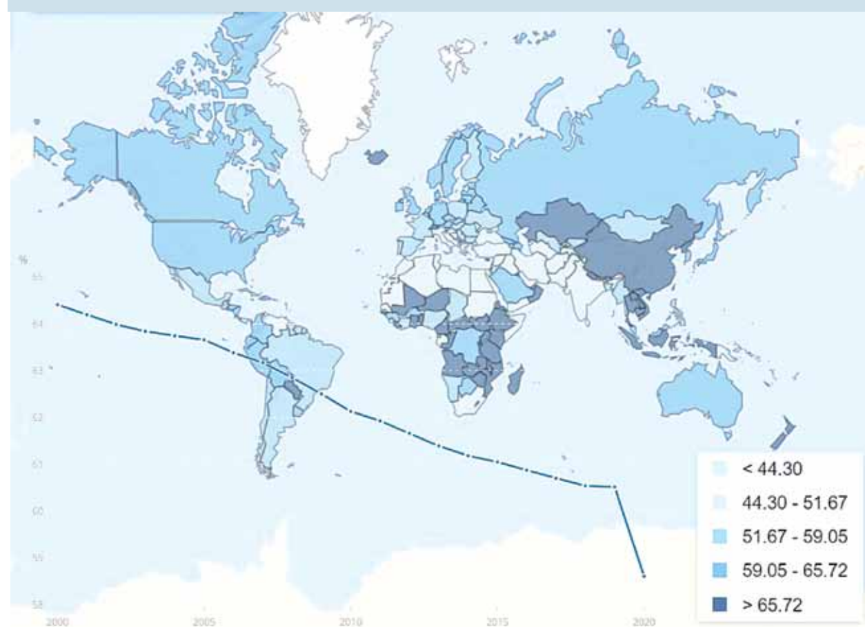
Διάγραμμα 1: Πλήθος εργαζομένων στον κόσμο ως ποσοστό του συνολικού ενεργού πληθυσμού (15+ ετών)